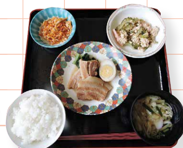
郷土料理 (沖縄県) /2018.8.21