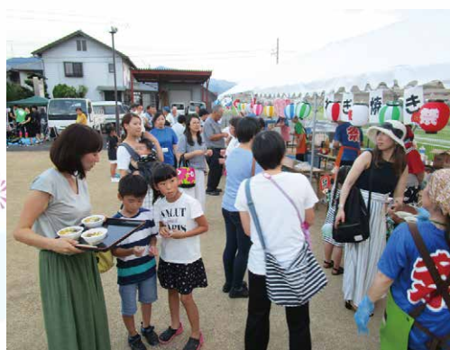
石井 / 2018.8.3 利用者様、ご家族や 地域の方で大賑わい！