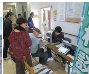
健康づくりチェック