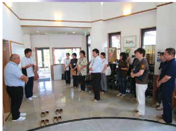
ケアマネジャー見学会