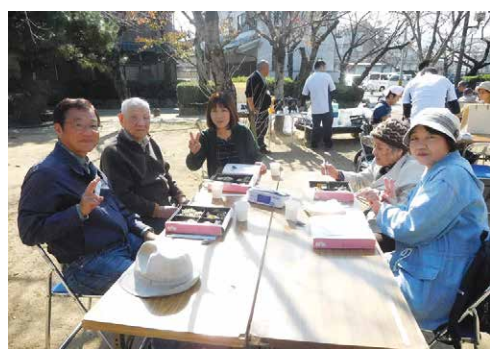
地域の公園へ遠足に

「多くの人と心触れ合う日」として、グループホーム・デイサービスの利用者様に想いを持って各イベントを開催しました。