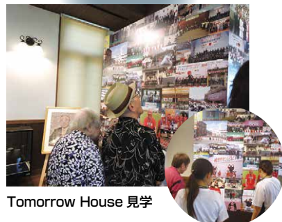
Tomorrow House 見学