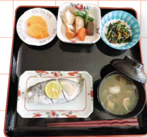
秋まつり (ぼうぜ姿寿司) /2018.10.28

みなさまの一番の楽しみである『食』にも 力を入れて取り組んでいます。 季節に合わせた行事食はもちろん、認知症 予防料理や全国各地の郷土料理・駅弁・空 弁などを調理員が腕によりをかけて再現し て喜んでいただいています。