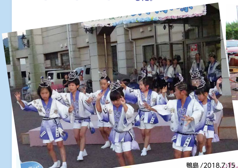
鴨島 / 2018.7.15 徳島といえば阿波踊り！ 舞絆踊連のみなさんが 披露してくれました！！

各地域ごとに納涼祭を開催しています。それぞれの施設で、利用者様をはじめ、ご家族や地域の皆様にも楽しんでいただけるようなイベントや模擬店を行いました。