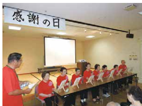
利用者様によるハンドベル演奏