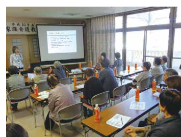
家族介護教室開催