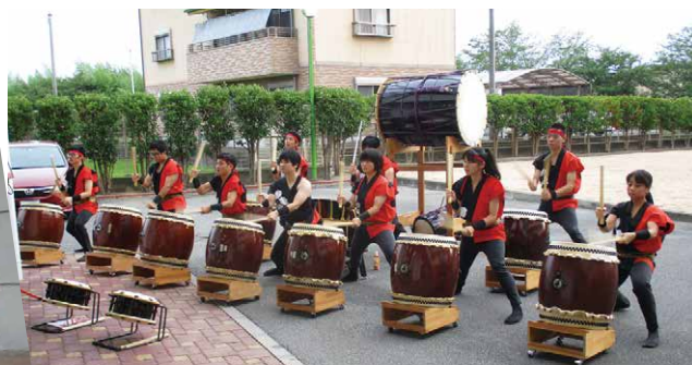
上板 / 2018.7.28 国府支援学校のみなさんによる和太鼓演奏！