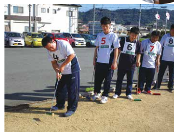
職員ゲートボール大会