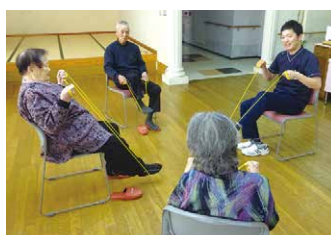
訓練指導員による体操