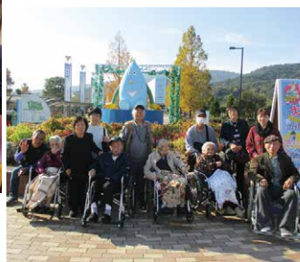
あすたむらんどへ遠足